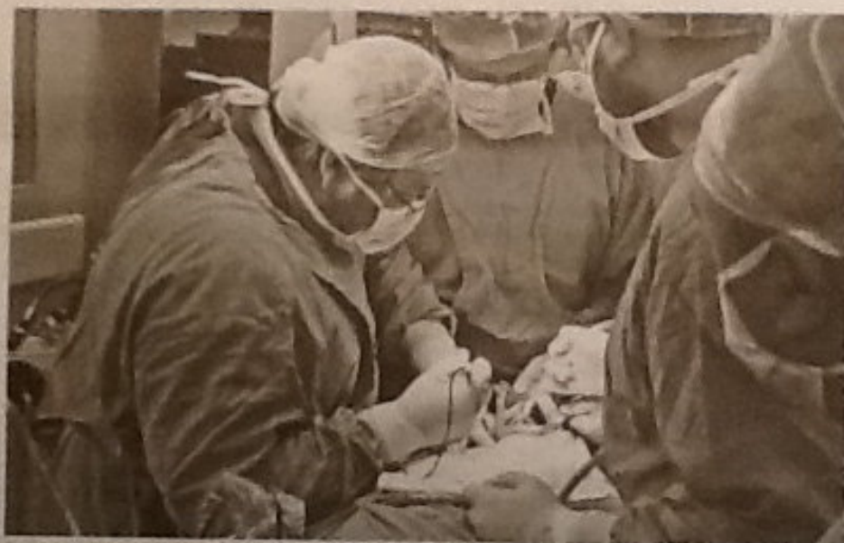
Cirujanos chilenos y norteamericanos desarrollan una labor ardua y muy coordinada.